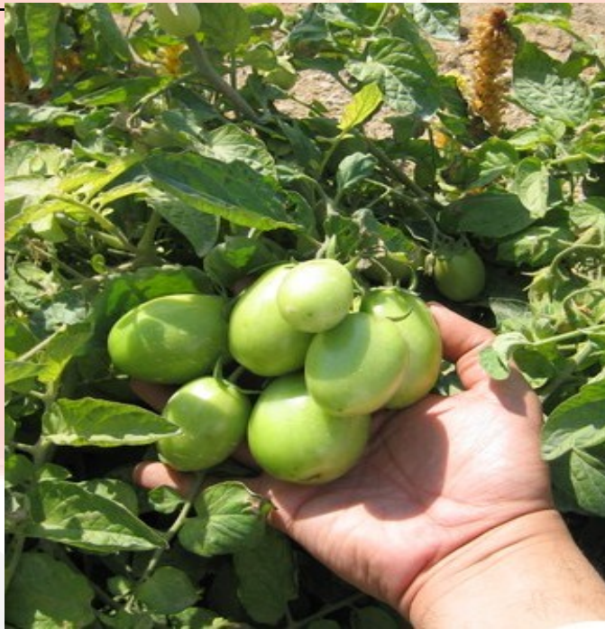
گوجه فرنگی نارس (کال)