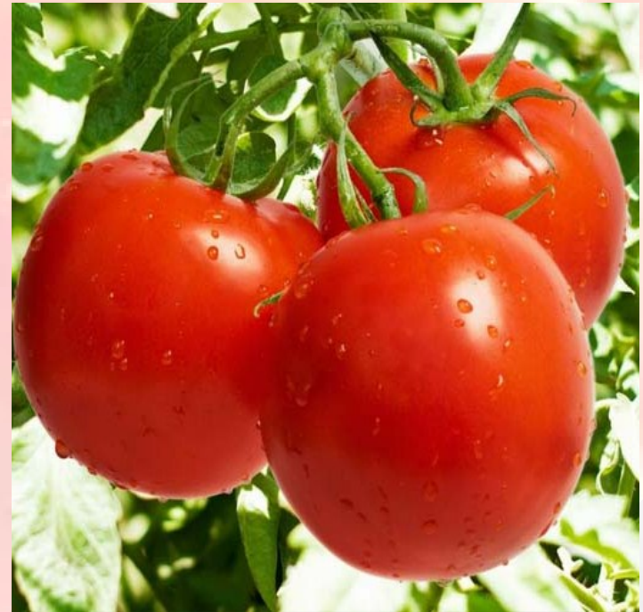
گوجه فرنگی رسیده (آماده برداشت)